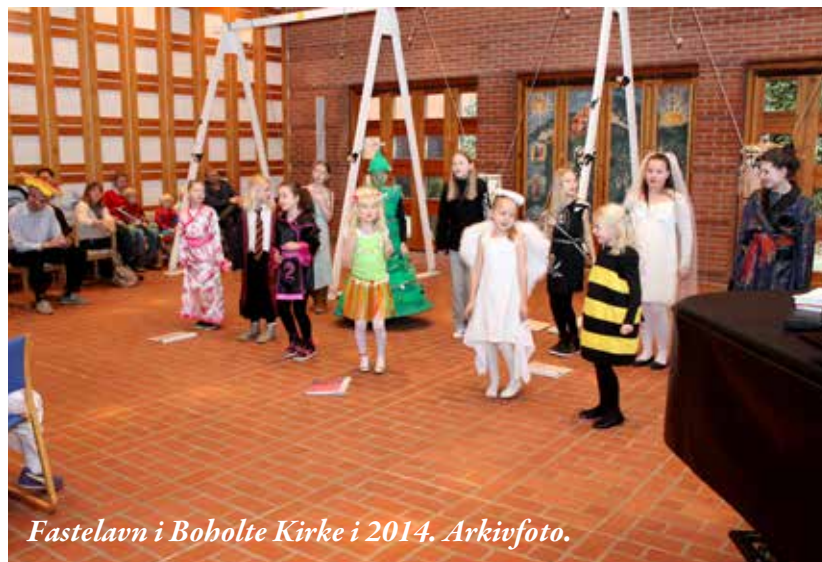
Fastelavn i Bobolte Kirke i 2014. Arkivfoto.