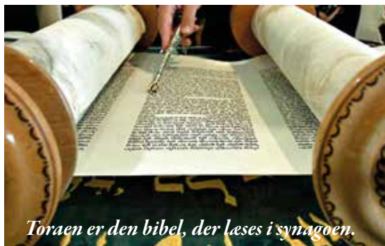
Toraen er den bibel, der læses i synagoen.